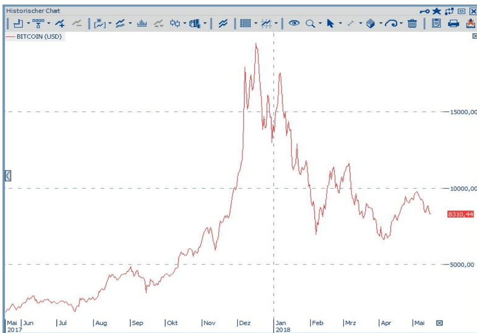
Abbildung: Historischer Chart