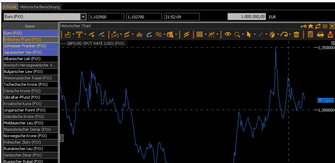
Abbildung 1: Aus dem Cross-Rate-Rechner heraus aufgerufene historische Chartdarstellung